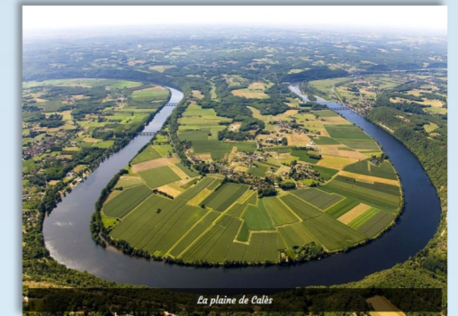
La plaine de Calès