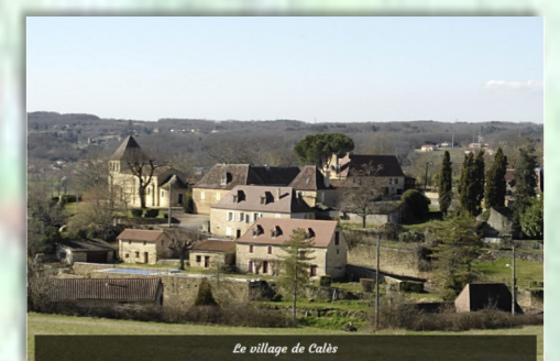
Le village de Calès