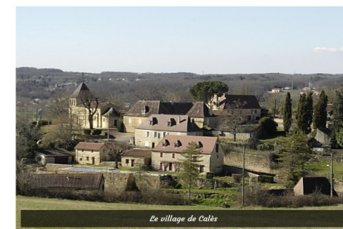
Le village de Calès