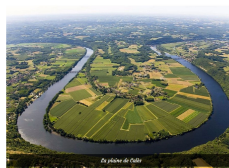
La plaine de Calès